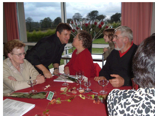
Prétexte pour faire la bise aux dames