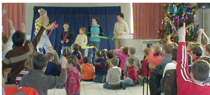
Même Madame la Directrice s'est exercée à la fabrication d'un chien avec un ballon