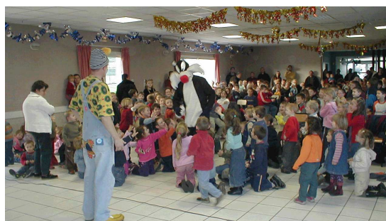
Gros minet était de la fête

Comme chaque année, la journée s'est achevée avec l'arrivée du Père Noël et de ses cadeaux.