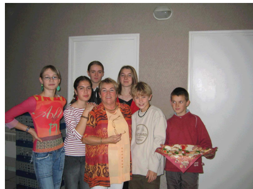
Une petite pause avant le service