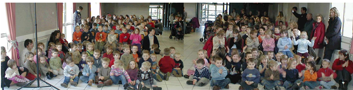
Une fête de fin d'année très réussie

Nous remercions toutes les personnes qui nous soutiennent et donnent un peu de leur temps pour nous aider.