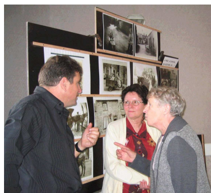
C'était au temps....

Ces photos seront prêtées aux écoles pour développer et commenter un thème historique.