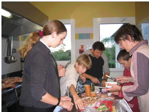
Mettre la main à la pâte