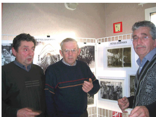
Alors, on fait la fête ?