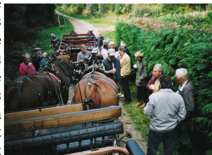
Un petit verre sur la route

En plus du programme prévu, nous avons fait, au mois de septembre, une randonnée en calèches à travers bois au départ de Saint Pierre d'Arthéglice. Nous avons déjeuné dans une grange sur la commune du Vrétôt « c'était champêtre ». Chacun était enchanté de cette journée.