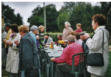
Petit déjeuner avant le départ

Toujours autant d'activités à l'association « LoReHa ». Comme je vous l'ai déjà annoncé dans le dernier bulletin, nous avons visité l'île de Tatihou en mars et effectué une croisière sur la Rance avec la visite de Dinan et Saint-Malo en juin. En octobre, le spectacle de Caen a été apprécié par tout le monde.