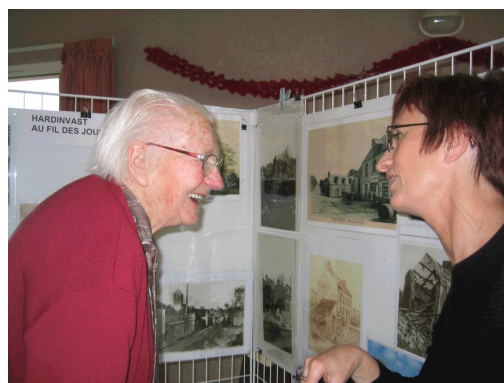
Au fil des jours, les générations...