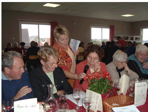
Les chansons traditionnelles