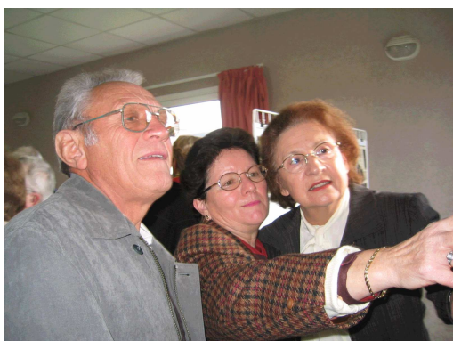
Tu crois que c'est elle ?