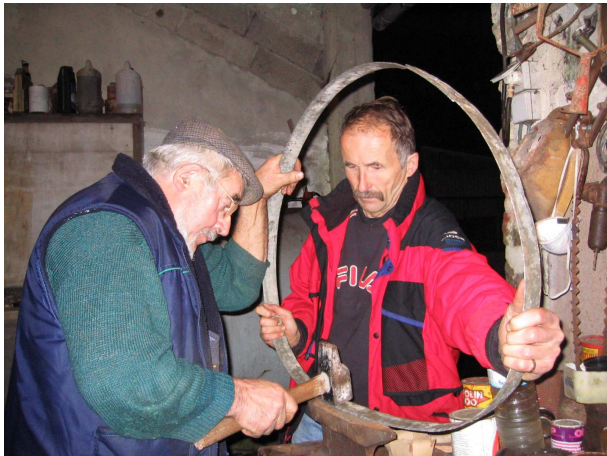
Attention les doigts !