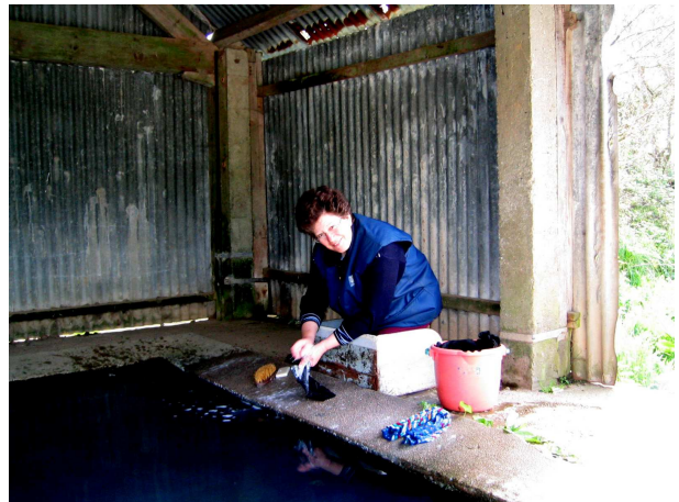
Il existe encore quelques lavandières qui vont au lavoir avec le sourire..... Et le linge sent si bon.