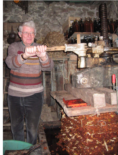
De l'eau ferrugineuse non, du jus de pomme oui