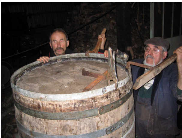
Le remontage avec cerclage d'un tonneau n'est pas si évident avec le « chien » et la « chienne ».