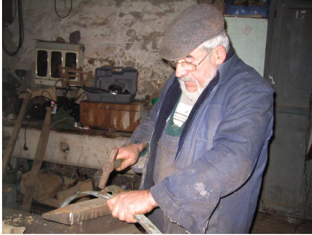
Mise en forme du cerclage du tonneau